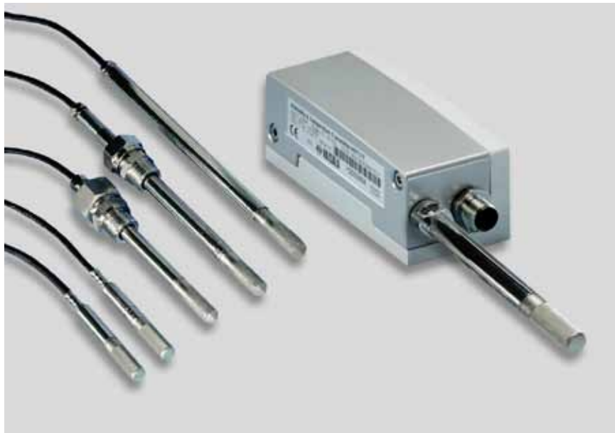
Modely převodníků HMT310

Zleva doprava: HMT313, HMT317, HMT314, HMT318, HMT315 a HMT311.