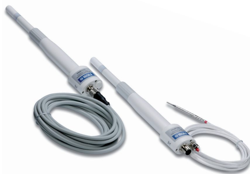
Sonda HMP155 s novým stabilním senzorem HUMICAP®180R a s přídatnou teplotní sondou