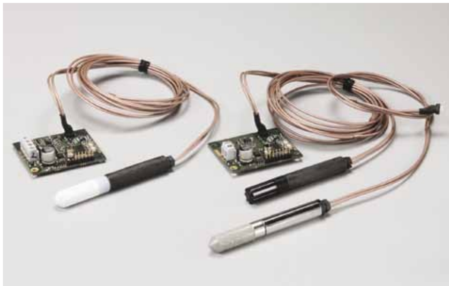
Modul Vaisala HUMICAP® HMM100.